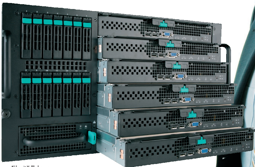
Abb. mit Vollbelegung